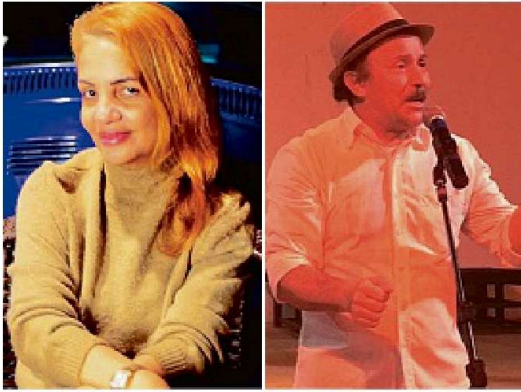
Influenciadora e ator alegaram estar passando por dificuldades