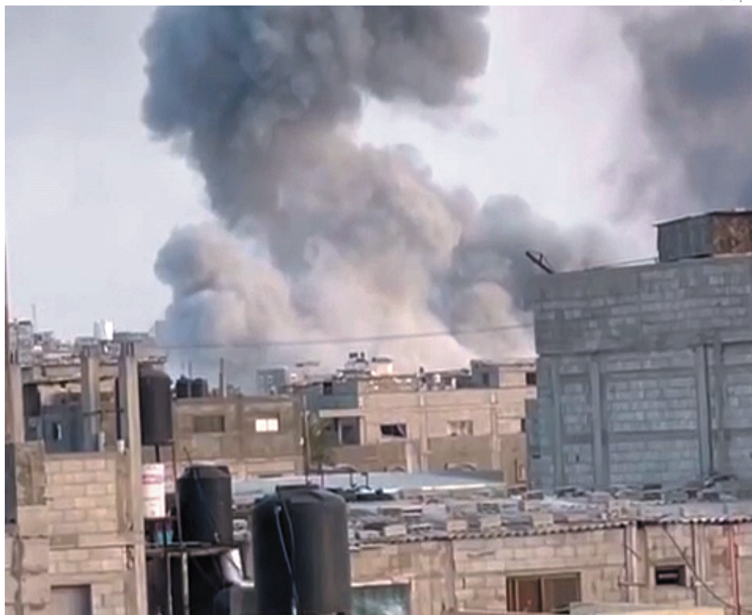
O ataque israelense foi duramente criticado, inclusive nos Estados Unidos; isso não impediu as mortes

O primeiro-ministro de Israel, Binyamin Netanyahu, prometeu seguir em frente, dizendo que as forças israelenses devem ir para Rafah