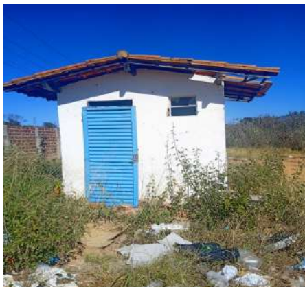
Figura 3: Guarita.