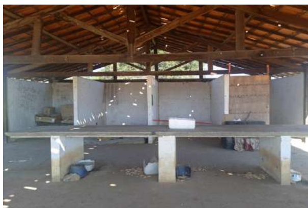
Figura 4: Área de armazenamento.