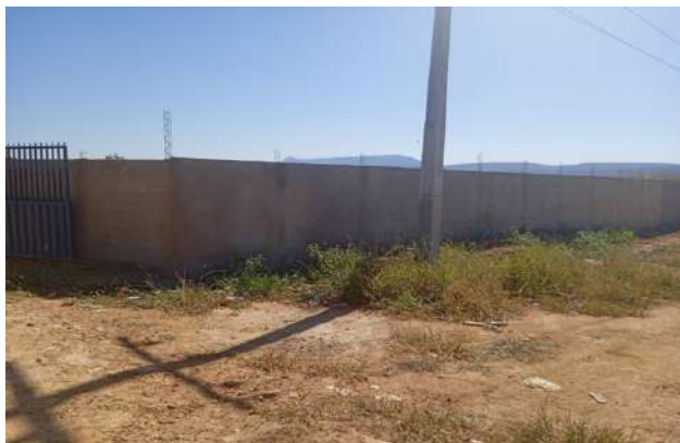
Figura 1: Área externa do lixão onde será construído cinturão verde.