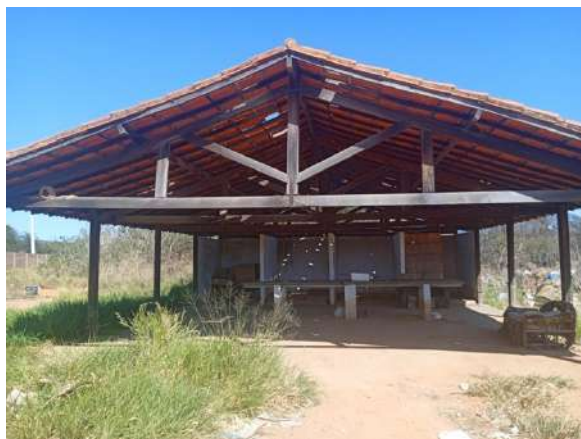
Figura 2: Área de triagem.