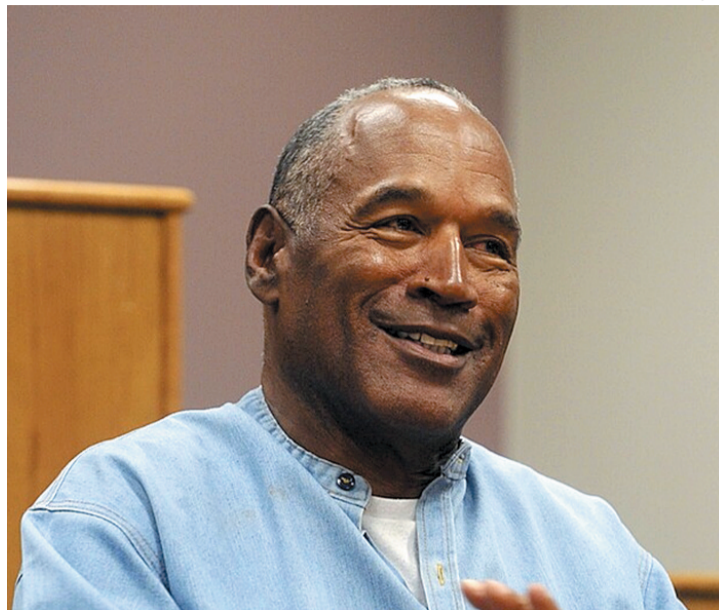
O.J. ficou preso por nove anos, saiu em 2017 e vivia em Las Vegas

Ele também foi ator e trabalhou em programas de televisão, mas ficou marcado pelo julgamento do assassinato a facadas da ex-mulher, Nicole Brown Simpson, e seu amigo, Ron Goldman, durante a década de 1990. O caso gerou grande repercussão na época e ficou conhecido como o ‘julgamento do século’, gerando debate sobre racismo no