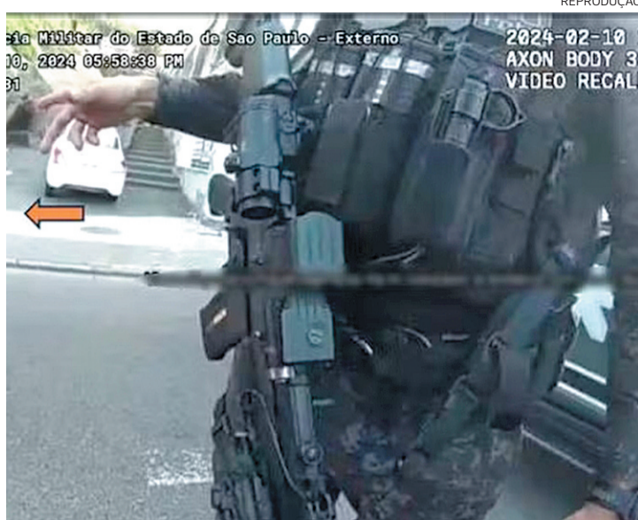
PMs teriam forjado confronto e dificultado a captação de imagens

Ao todo, ao menos 84 pessoas foram mortas no âmbito das operações Verão e Escudo, esta última deflagrada no fim de julho do ano