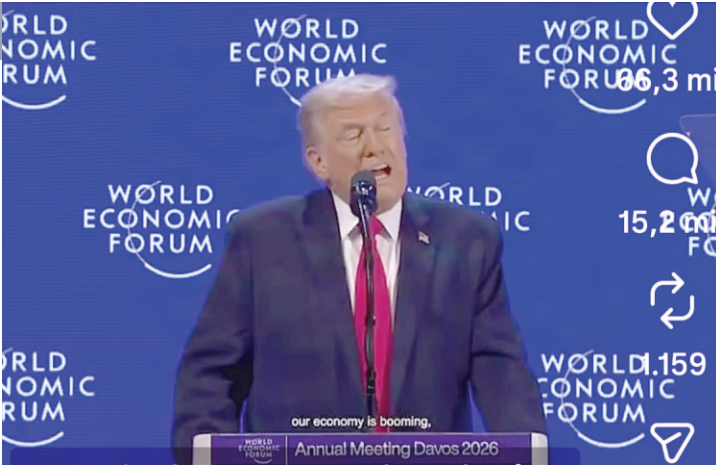
Em Davos, Trump chamou Groenlândia de “pedaço de gelo”

dos os membros da aliança militar. Apesar do tom conciliador quanto ao uso da força, Trump manteve uma retórica incisiva durante o Fórum Econômico Mundial, em Davos, onde chamou a Dinamarca de “ingrata” e referiu-se à Groenlândia como um “pedaço de gelo”. O presidente defendeu que o ter-