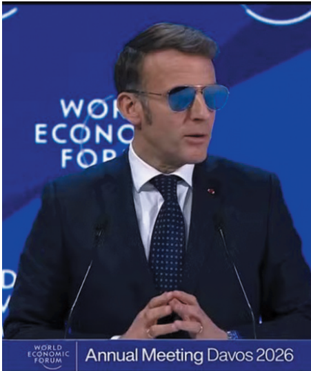
O Henry Jullien custa R$ 4 mil