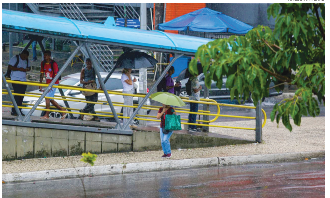
A previsão indica maior instabilidade no fim da semana; ontem (6) foram registradas chuvas na capital

O fim de semana volta a ser mais chuvoso. No sábado (11), a chance de chuva é de 60%, enquanto no domingo (12) chega novamente a 70%.