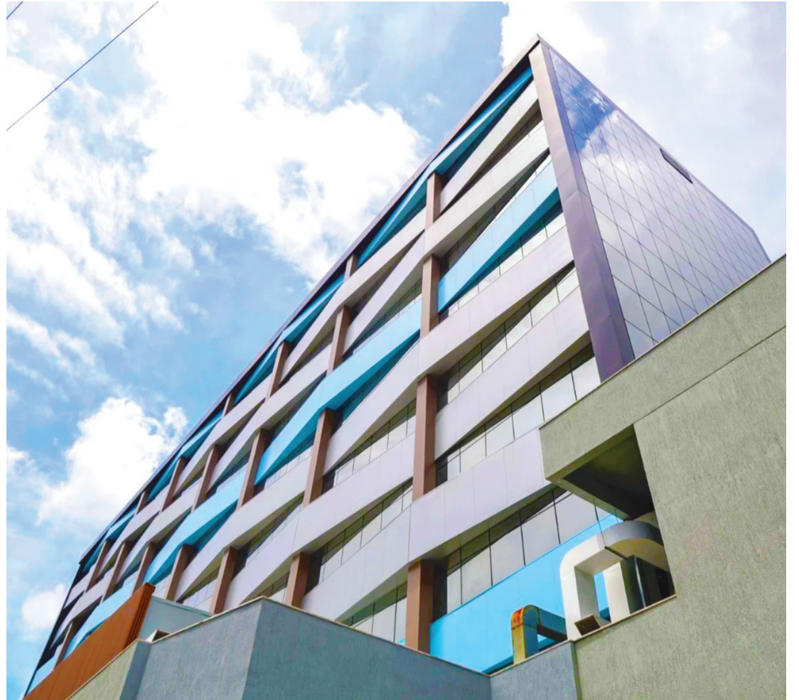
Maternidade e Hospital da Criança Deputado Alan Sanches terá nove pavimentos e 198 leitos

“Cada etapa é acompanhada com muito rigor técnico. Sabemos da importância desse equipamento para a cidade. Este não é apenas um prédio, é um investimento de mais de R$ 100 milhões em cuidado e proteção à vida, em assistência moderna, se-