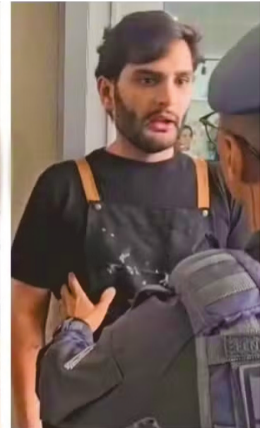
Imagens registradas por câmeras de segurança mostram o momento em que a mulher agride cabeleireiro