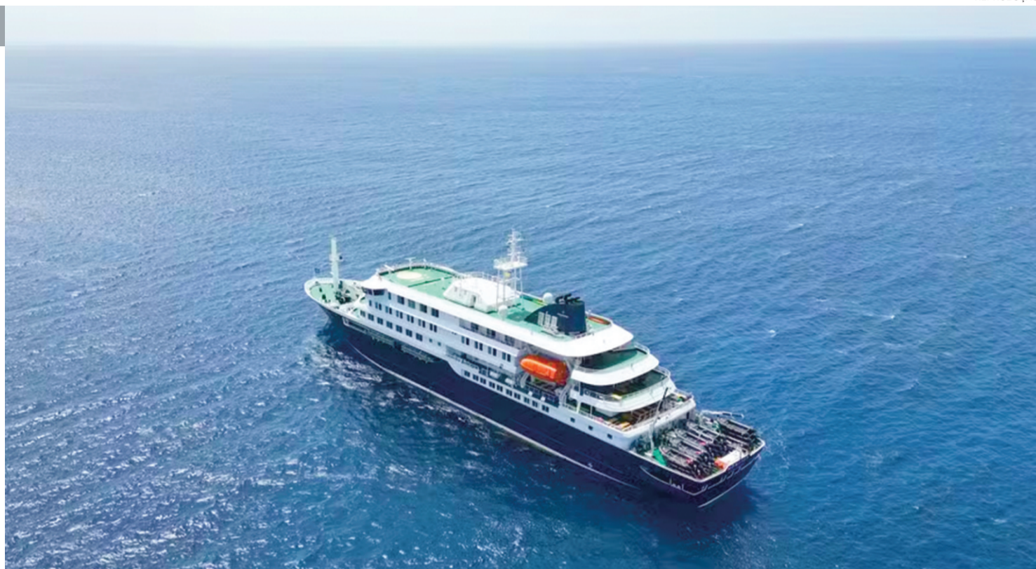
Espanha e OMS concluem desembarque do cruzeiro 'MV Hondius' em Tenerife e a operação foi validada como “padrão ouro” para protocolos

Os envolvidos - um homem de 55 anos e uma mulher de 60 - estavam seminus nos assentos da fileira F do voo CM 836, proveniente da capital panamenha, quando foram denunciados.