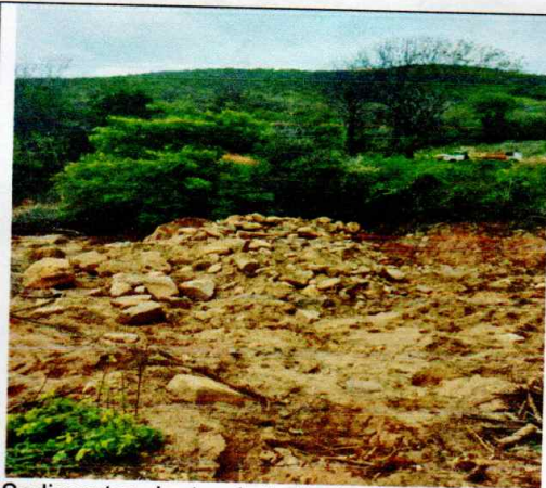
Sedimentos dentro do Leito do Rio